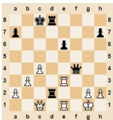
♚ Мат в 2 хода