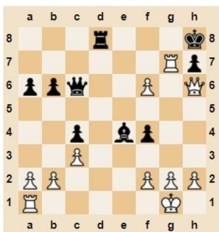
♔ Мат в 2 хода

Контроль эффективности осуществляется при выполнении диагностических заданий и упражнений, с помощью типичных шахматных задач, наблюдений. Мат в 1 ход; Мат в 2 хода; Мат в 3 хода; Мат в 4 хода; Мат в 5 ходов.