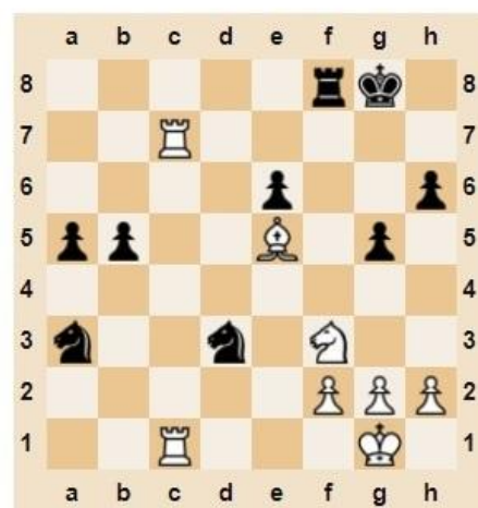
♔ Мат в 4 хода