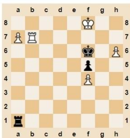
♔ Мат в 1 ход