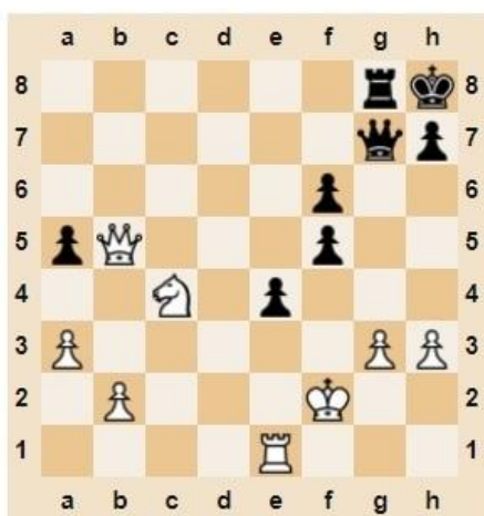
♚ Мат в 3 хода